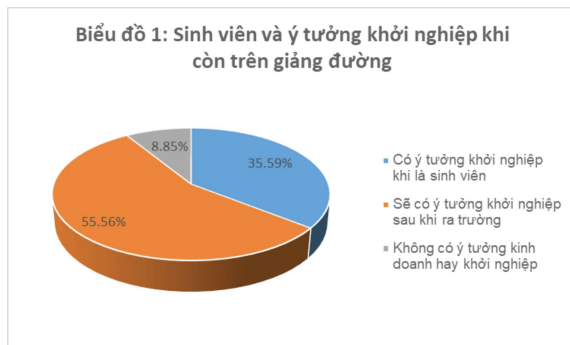
Biểu đồ 1: Sinh viên và ý tưởng khởi nghiệp khi còn trên giảng đường